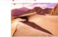
ทะเลทรายคัทปานา

DAY2 อิสลามาบัต-บินภายในสู่เมืองสการ์คู-ทะเลทรายคัทปานา